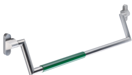
Barre anti-panique Système 162